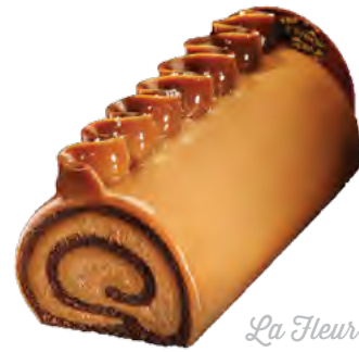
La Fleur de Sel

biscuit aux amandes, mousse chocolat lait et mousse noisettes, croustillant praliné amandes/noisettes